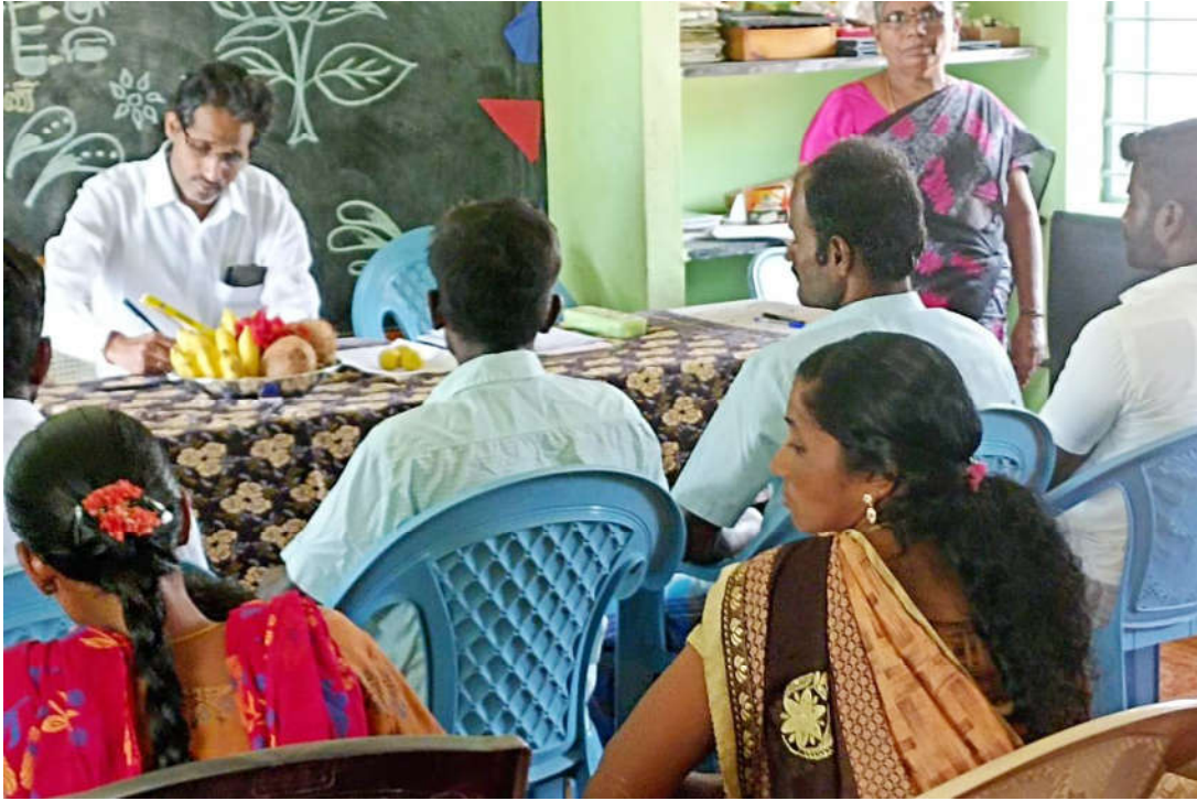
இடம்: அ.உ.நி.பள்ளி, கடம்பூர்